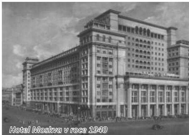
Hotel Moskva v roce 1940

V neděli 10. května 2005 dělníci, kteří demontovali podpěrné piloty na dně stavební jámy pro nové podzemní parkoviště na místě bývalého hotelu Moskva objevili kusy vojenské trhavinny typu Tritol.