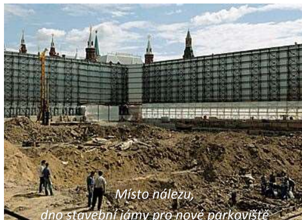
Místo nálezu, dno stavební jámy pro nové parkoviště

Poprvé se tak stalo již v zimě 1981, kdy v rámci bezpečnostních opatření před XXVI. sjezdem KSSS (b), kdy během rutinní kontroly budovy tehdejšího Gosplanu 4 kdosi příliš energicky přibouchl dvířka elektrického rozvaděče.