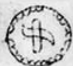
kovový odznak WW

Členové jednotlivých skupin používají pro zjišťování a spolupráci různá smluvená znamení, znaky a hesla. Na mnoha místech byla tato znamení a znaky nalezeny. Pokud nám je jejich význam znám, uvádíme je: