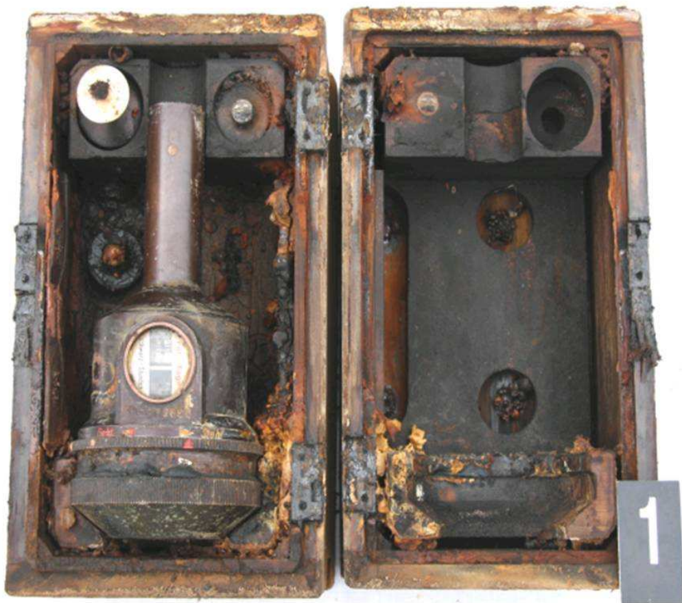
Časový rozněcovač J-Feder