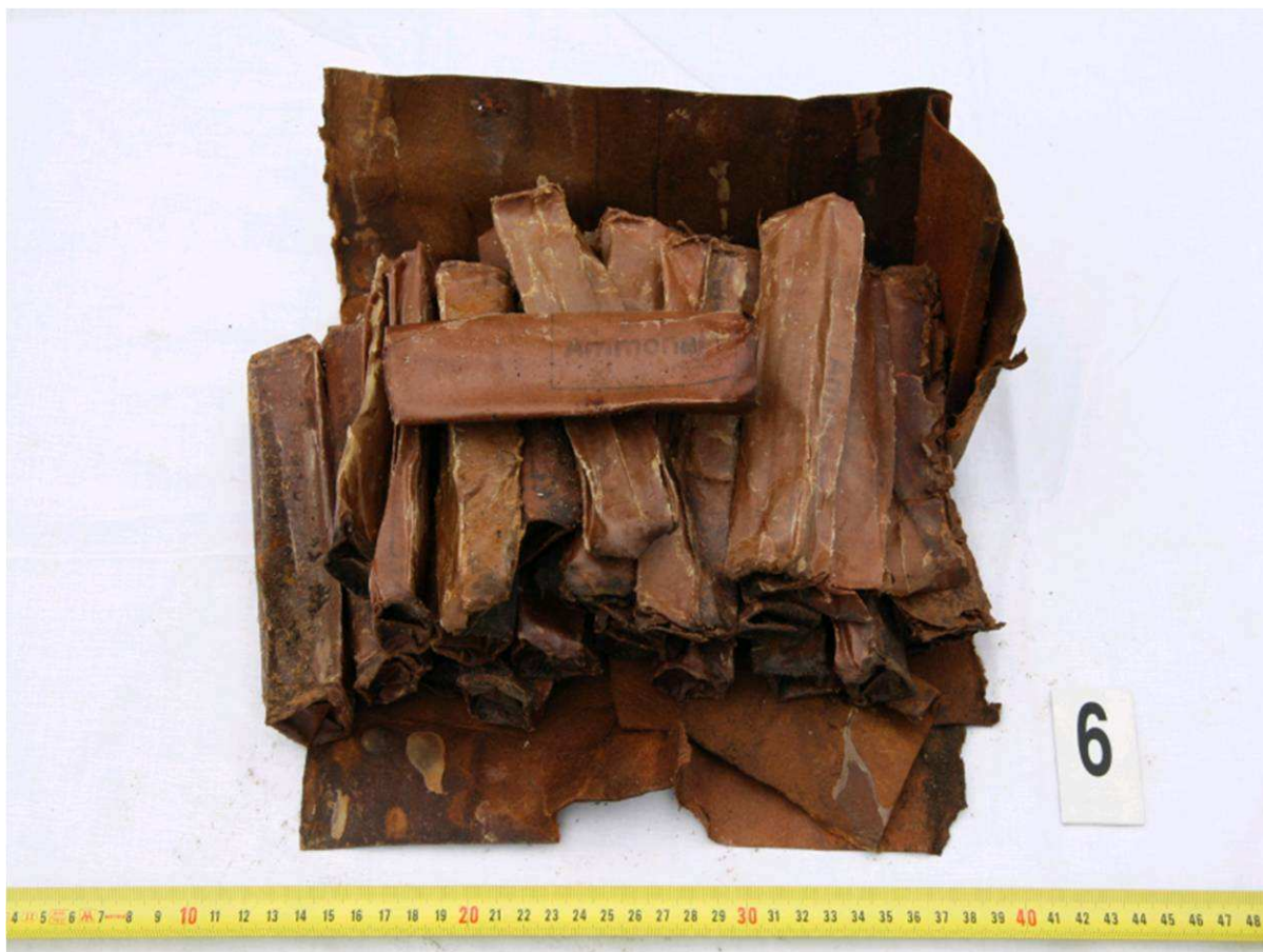
100 g oblé náložky průmyslové trhaviny Ammonal 1, silně poškozené vlhkostí