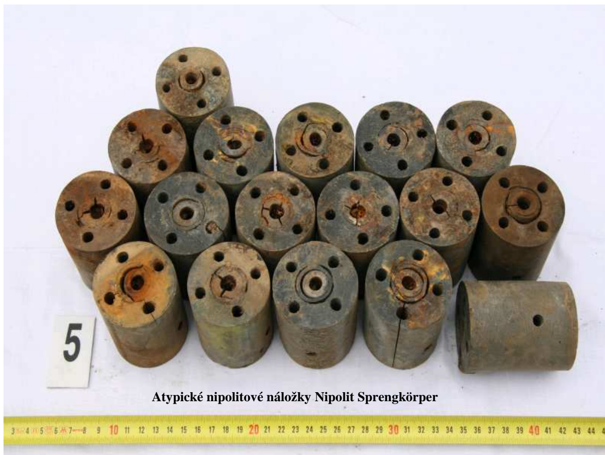
Atypické nipolitové náložky Nipolit Sprengkörper