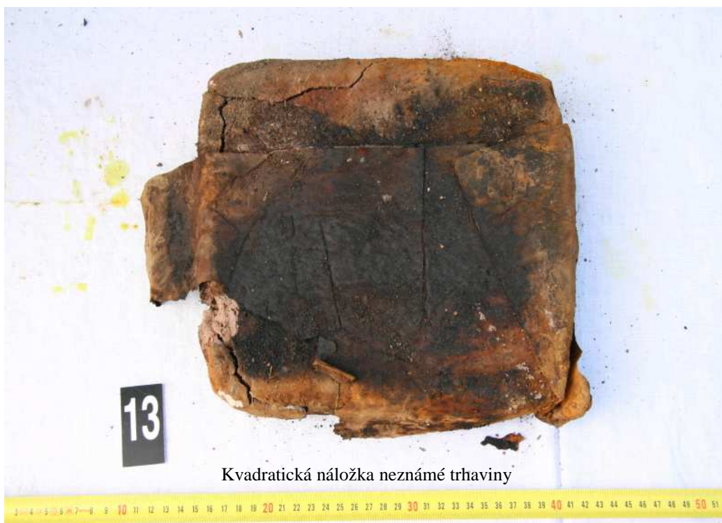
Kvadratická náložka neznámé trhaviný