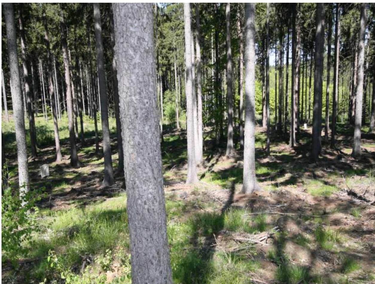
Pohled na obě místa nálezů, v popředí místo nálezů ze dne 2. 7. 2007, v pozadí místo nálezů ze dne 3. 7. 2007

Na druhou stranu, plechová schránka s potravinami připomíná schránky z nálezů skladu S popsaného v příloze předcházejícího článku.