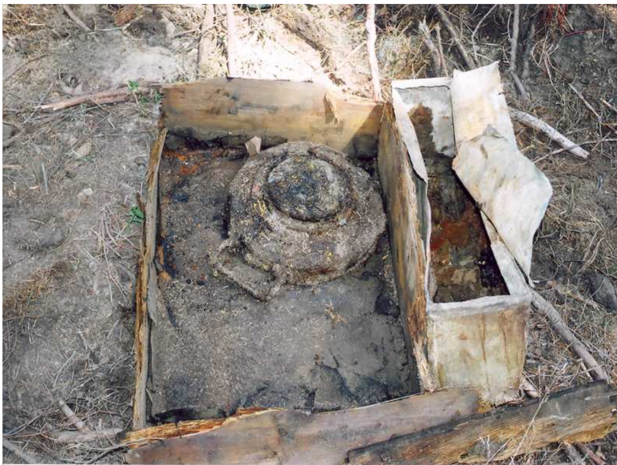
Pohled na dřevěnou schránku s T.Mi. Pilz. 43. V plechové krabici jsou viditelné zbytky proviantu