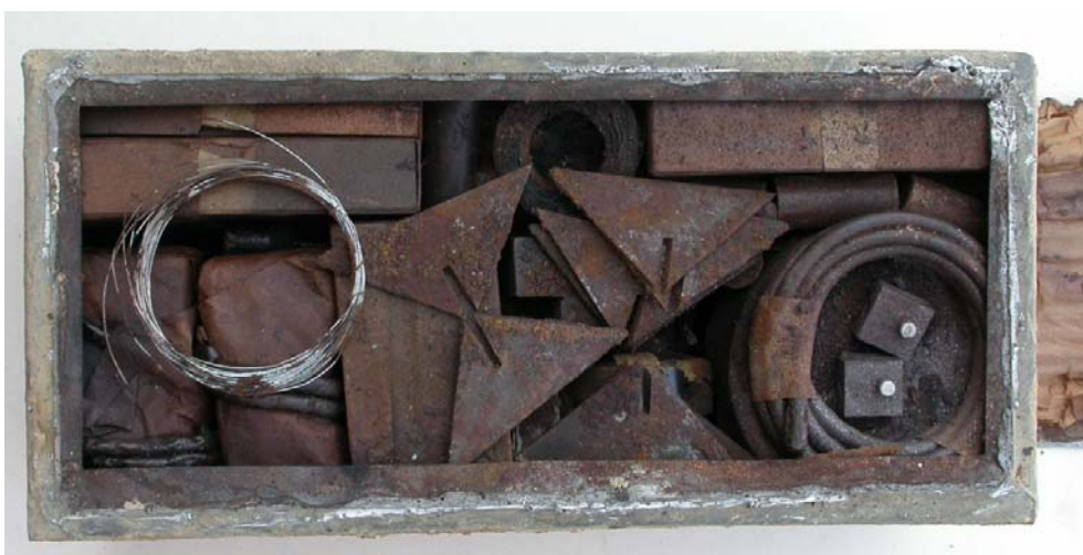
Krabice s materiálem „S“ – v různých fázích vyjímání obsahu