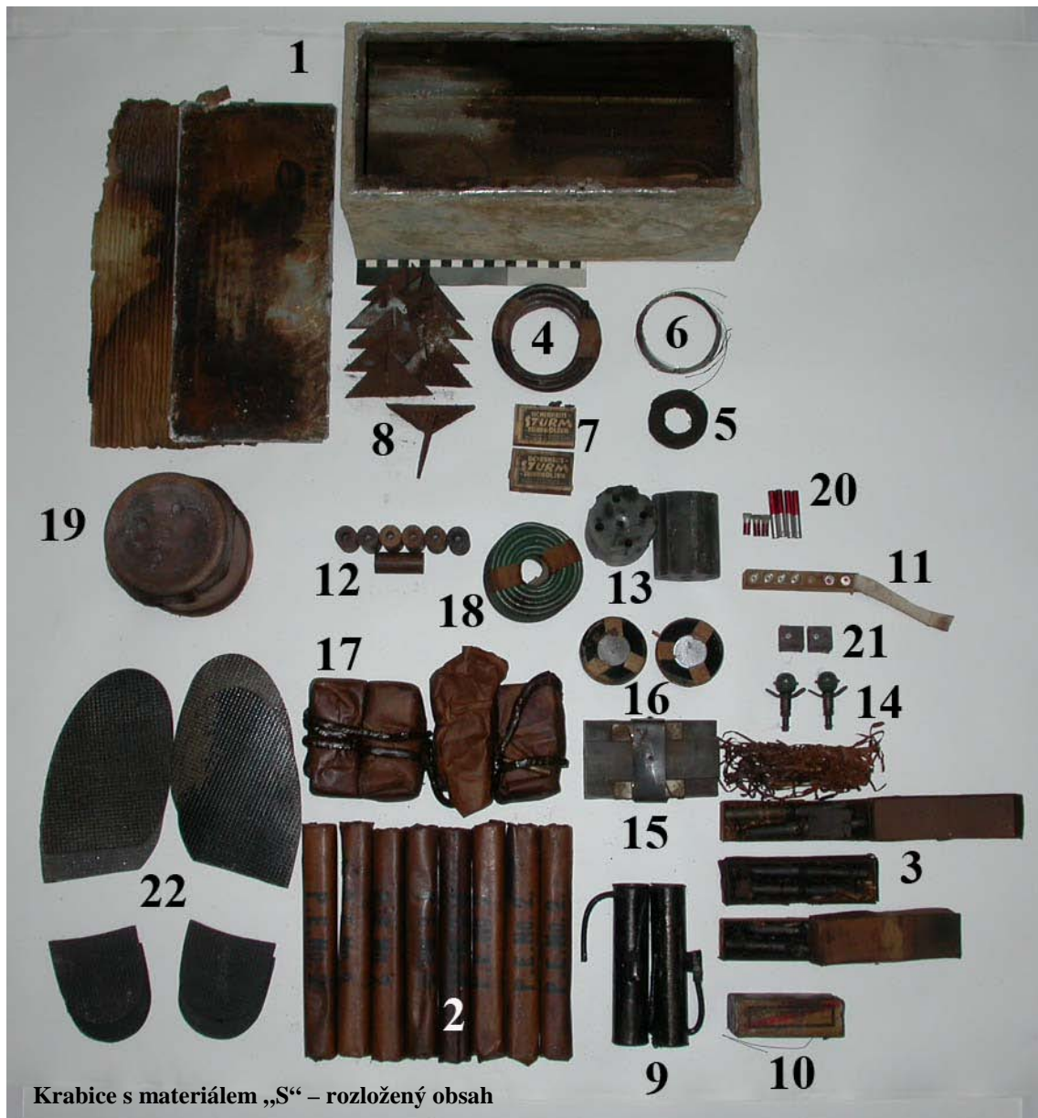
Krabice s materiálom „S“ – rozložený obsah