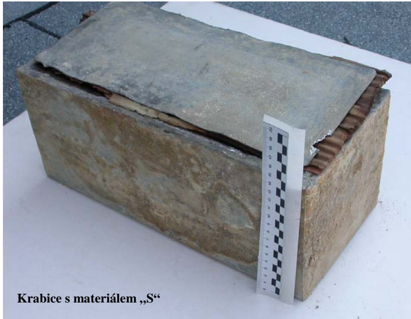
Krabice s materiálom „S“